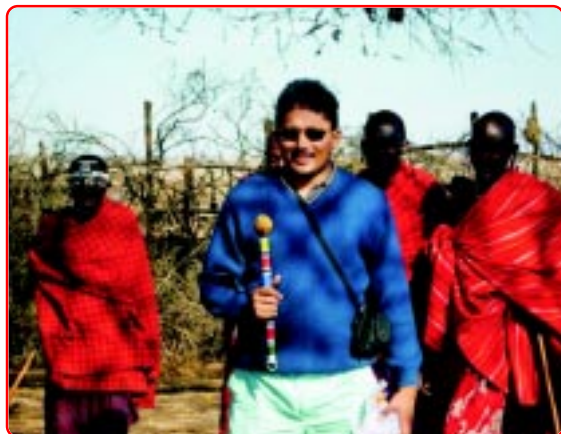
Papa with the Masai Dancers

When the rescue car came, it was already 5.15pm .Other people of the car which was stuck, went to another car which was leading us. As the sun was setting and it was getting dark, we decided to leave the place .The rescue people were left to get the car out of mud and bring later. So, now we were heading towards the Kikoti cottage hotel. We reached the hotel about one and half an hour later. On our way to hotel, it was lightning a lot and was very dark .We reached the hotel at 7.15 pm. The hotel people welcomed us by giving us wet refreshing towels. We all refreshed ourselves ,then they took us to campfire place .We warmed ourselves over there for half an hour. Then we got our room. On our way to the room inside, we felt like we were walking in a jungle. The surrounding was full of trees. Faint sound of animals, dark black atmosphere was terrifying. I was feeling sleepy although I got refreshed and mamma, papa too