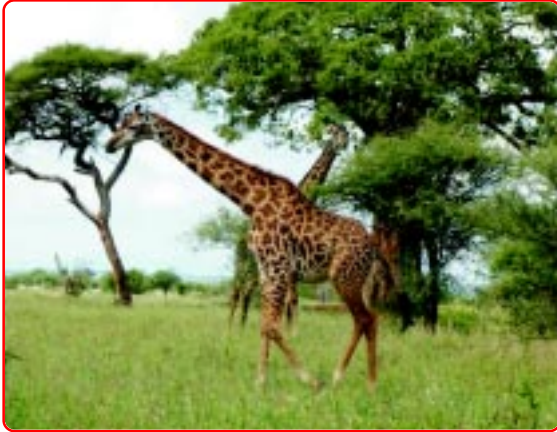
Giraffes In Tarangire National Park

After half an hour we saw a Baobab tree which was over 500 years old. It had two natural doors, one at the front and one at the back. There was a big hollow space in side the tree trunk. Inside the trunk thieves and poachers used to hide. There was a big stone near the front door. There were some nails attached to the tree inside which was used by the jungle masais to go up. It was so amazing, we couldn't believe. Then we started back. We found the roads were muddy and slippery. The car was facing problem to move ahead, it was scary to me. I and Ana were holding each other tightly. Just after few minutes the second car got stuck in mud very badly. Everyone got down to help it comes out but it couldn't. Then Mr.Sekifu called a rescue car. It came after about half an hour. The driver and my father got out of the car. I, papa and Anna stayed in the car. One of the window was open and one dangerous fly came in and was about to bite my mom but she killed it. When we were roaming in the park the roof of the car was open, so now we asked our driver to close it and the windows.