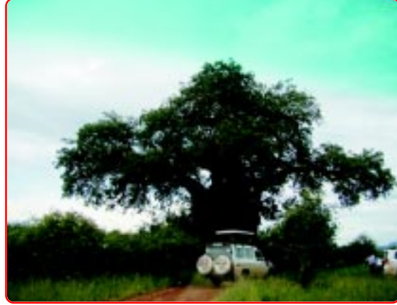
The Great Baobab Tree.

After half an hour we saw a Baobab tree which was over 500 years old. It had two natural doors, one at the front and one at the back. There was a big hollow space in side the tree trunk. Inside the trunk thieves and poachers used to hide. There was a big stone near the front door. There were some nails attached to the tree inside which was used by the jungle masais to go up. It was so amazing, we couldn't believe. Then we started back. We found the roads were muddy and slippery. The car was facing problem to move ahead, it was scary to me. I and Ana were holding each other tightly. Just after few minutes the second car got stuck in mud very badly. Everyone got down to help it comes out but it couldn't. Then Mr.Sekifu called a rescue car. It came after about half an hour. The driver and my father got out of the car. I, papa and Anna stayed in the car. One of the window was open and one dangerous fly came in and was about to bite my mom but she killed it. When we were roaming in the park the roof of the car was open, so now we asked our driver to close it and the windows.