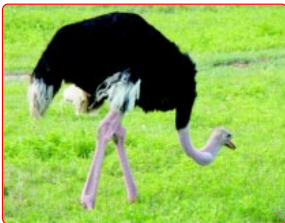
An Ostrich in the wild.

After few minutes we saw a big group of Ostrich and on the left two giraffes playing and hugging with each other. We took some nice photos.