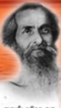
ଡଃ ଡାକ୍ତରଙ୍କ ବାବୁ