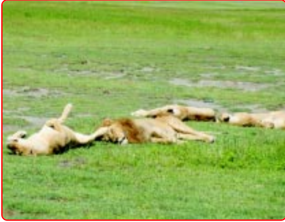
Lions in the Ngorongoro Crater.

We saw six lions were sleeping and one was guarding them. That lion started to come towards us. We all were standing near the open roof so mama said “I am getting afraid, now sit down”. But it did not come to us. In stead it sat facing us. One lion was sleeping upside down with his four legs facing towards the sky. It was very funny pose. We all laughed so much. But in a low voice (like whispering).