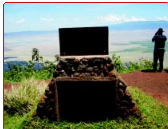
Ngorongoro Crater, from the top.

Then we went ahead a little and then our car got stuck in the mud. Just then another car was coming. They helped us to pull out the car. There were three tourists from Zambia, we thanked them and moved ahead. Then after an hour we reached Karatu on our way to Ngorongoro crater. In half an hour we reached the Ngorongoro National Park main gate. There were many baboons. Mama and papa showed some papers to the people at the main gate and paid the entrance fees. Then we started for the crater. After half an hour we reached the view point.