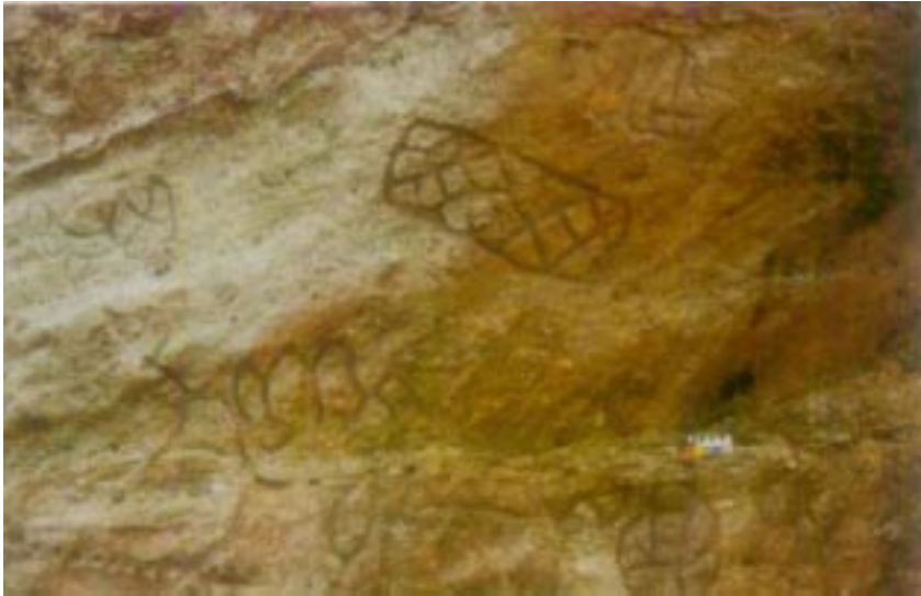
Prastara Khodita Chitra ( Usakothi , Sundargarh )