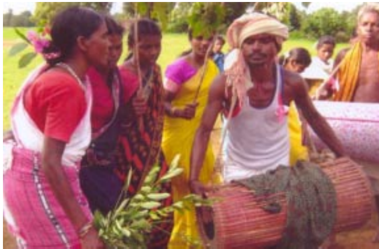
Adibasi Loka Nrutya