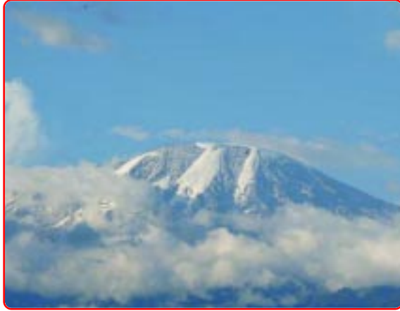
Mount Kilimanjaro, The Roof of Africa.

across the Mount Kilimanjaro, on the way to Arusha. It is the highest point in Africa with a snow cover. But now the snow cap is melting due to global warming.