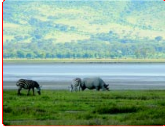
Rhino and zebras in the Ngorongoro Crater.

Then we went to look for more animals. We saw a big group of flamingos and they were drinking water from a small lake in the crater. We also saw an elephant taking sand bath. We found a Rhino also. I was seeing a rhino for the first time in my life. Zebras were roaming near the rhino and it was doing nothing as if they were friends.