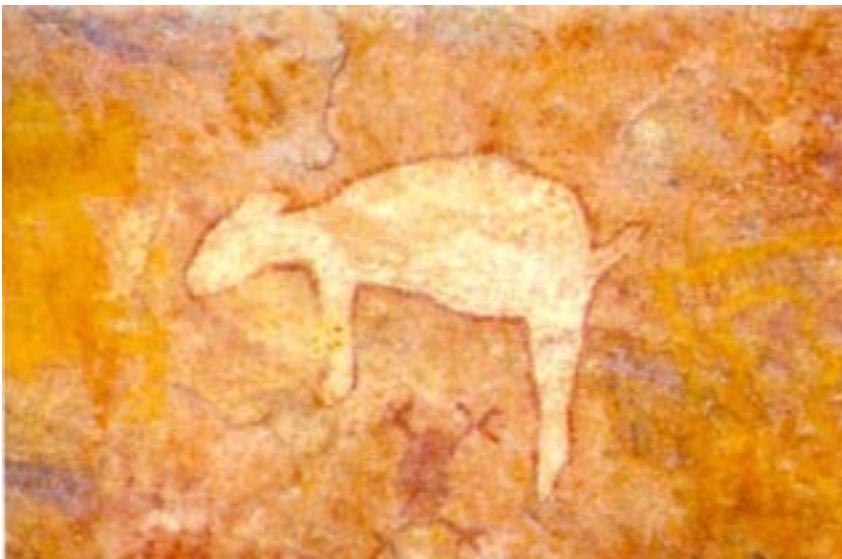
Prastara Khodita Chitra ( Lekhamunda, Sundargarh )