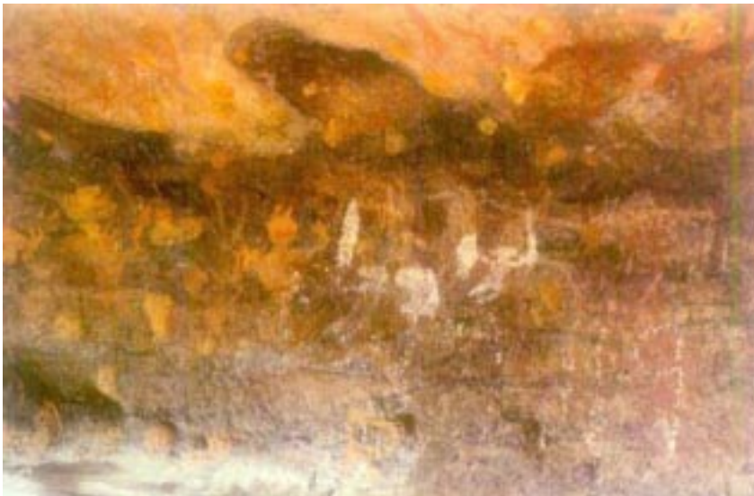
Prastara Khodita Chitra ( Manikamunda, Sundargarh )