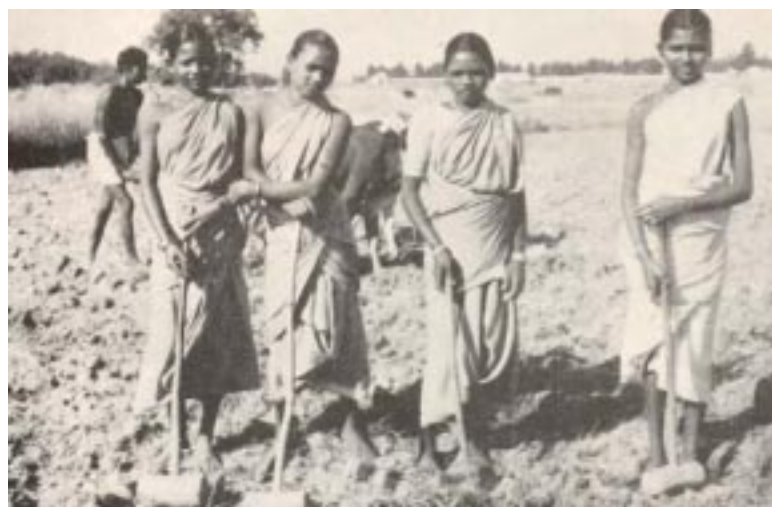
Adibasi Krushi Jeebana