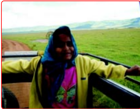
It's me, inside the crater

We saw six lions were sleeping and one was guarding them. That lion started to come towards us. We all were standing near the open roof so mama said “I am getting afraid, now sit down”. But it did not come to us. In stead it sat facing us. One lion was sleeping upside down with his four legs facing towards the sky. It was very funny pose. We all laughed so much. But in a low voice (like whispering).